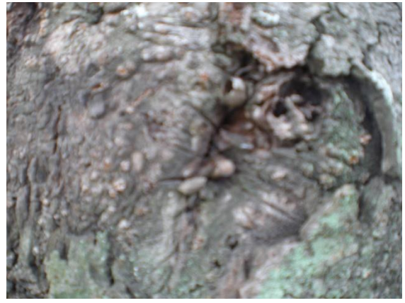
イラガ繭の脱皮孔