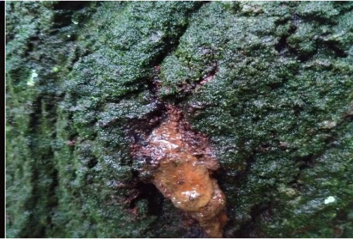
コスカシカバの侵入痕跡