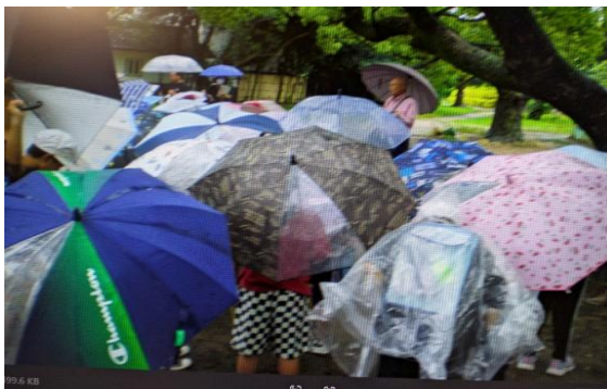
桜観察ポイントを班ごとに説明