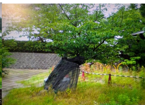
クビアカツヤカミキリの侵入防止ネット