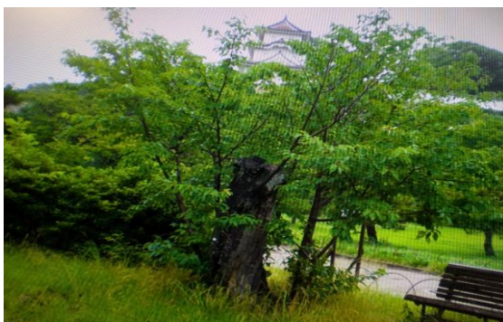
ヒコバエにより活性化した桜