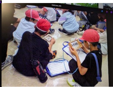
クビアカツヤカミキリの標本確認